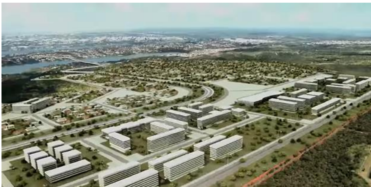
Figura 3 – Imagem 3D do novo empreendimento urbano denominado Taquari 2.

Ao se buscar as informações do Censo 2022 é possível verificar que no DF havia cerca de 1,17 milhão de moradias particulares, dos quais 182.657 domicílios se encontravam desocupados (15,58% do total, acima da média nacional que é de 13%). Somente no Plano Piloto havia cerca de 17,4 mil imóveis vazios. Análises do Instituto de Pesquisa e Estatística do DF (IPEDF) apontavam para 2022, um déficit habitacional no DF de 100,7 mil moradias, o que indica que o número de imóveis vazios é superior ao déficit habitacional.