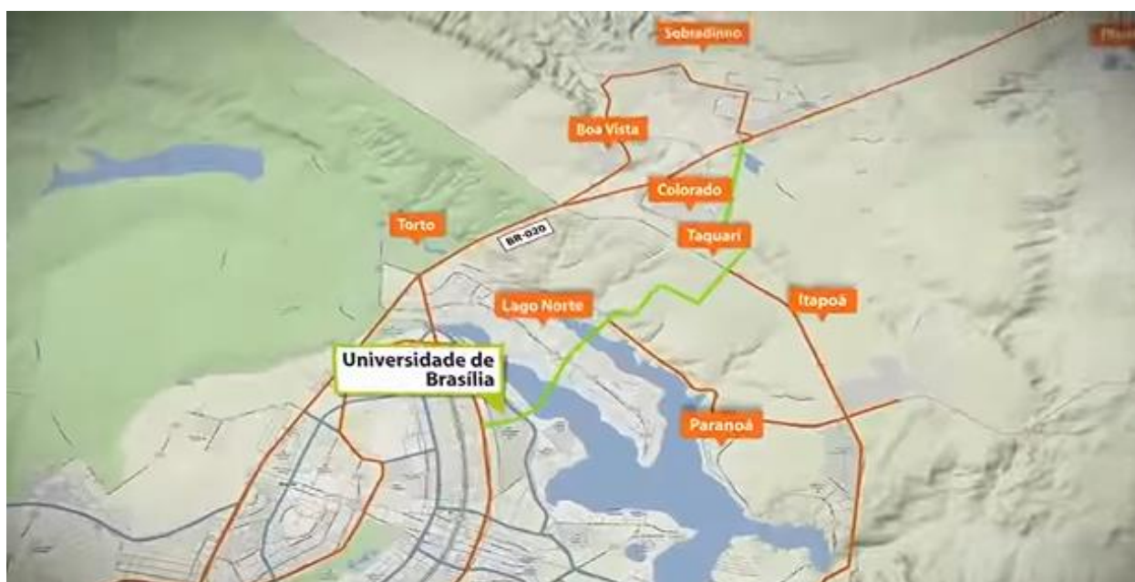
Figura 1 – Traçado Geral do Projeto da Nova Saída Norte – Em verde

Nesse Plano tem-se adequações no sistema viário sendo que um dos novos projetos é o denominado de Nova Saída Norte, ligando a Asa Norte à BR 020. Essa Nova Saída Norte passará pelo campus da Universidade e Brasília, Lago Norte, Taquari e chegará até Sobradinho. Tendo em vista as obras especiais de engenharia, percebe-se que solução adotada apresentará custos elevadíssimos. A Figura 1 adiante, indica esse novo sistema viário em verde.