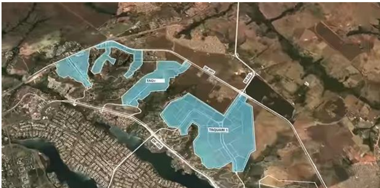
Figura 2 – Mancha Urbana do novo empreendimento urbano denominado Taquari 2.

Assim, esse projeto tem como objetivo ofertar imóveis para uma parcela da população do DF que já dispõe de diversos outros empreendimentos implantados ou em fase de implantação.